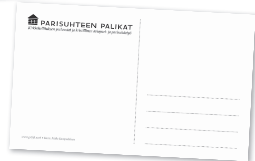
Parisuhteen palikat -postikortti.