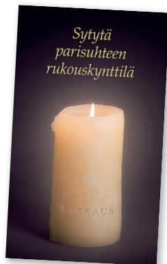
Sytytä parisuhteen rukouskynttilä ja Rakkaus-rukouskortti.